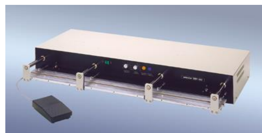
polystar® 1001 HM