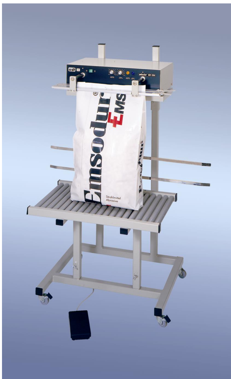
polystar® 601 HM 带起重货物设备