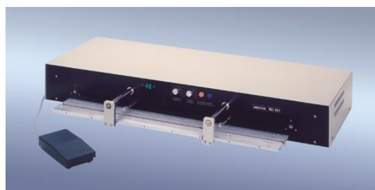
polystar® 801 HM